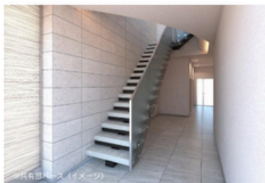
※共有部バス(イメージ)

●資料、共益費に消費税を含みます。その他、条件に記載の諸費用等に別途消費税が課されます。消費税率が変更された場合には、以降変更後の税率が課されることとなります。 ●正式な契約書及び賃貸条件の詳細等は別途説明させていただきます。予めご了承ください。●入居審査がございます。●空室状況は随時ご確認ください。●状況優先です。