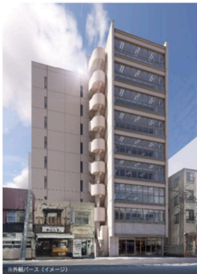
※外観バス(イメージ)

所在地 東京都千代田区神田駿河台2-10-4 竣工 2026年10月下旬(予定) 構造 鉄筋コンクリート造 規模 地上9階建 設備等 個別空調 EV2基(11人乗り) 機械警備(ALSOK) OAフロア 70mm 天井高2700mm